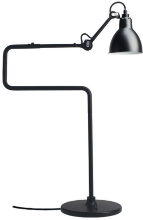
Table lamp | Lampe de table